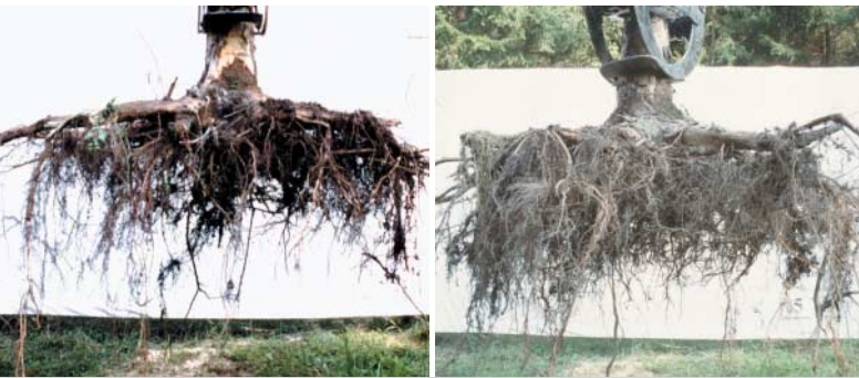
links: 35-jährige Fichte aus Winkelpflanzung: Flaches Wurzelwerk, geringe Wurzelentwicklung in die Tiefe. rechts: 35-jährige Fichte aus Naturverjüngung: Zahlreiche und starke Wurzeln wachsen in die Tiefe.

→ Selbst nach mehreren Jahrzehnten lassen sich Unterschiede zwischen Naturverjüngung und Pflanzung sowie zwischen verschiedenen Pflanzverfahren feststellen.