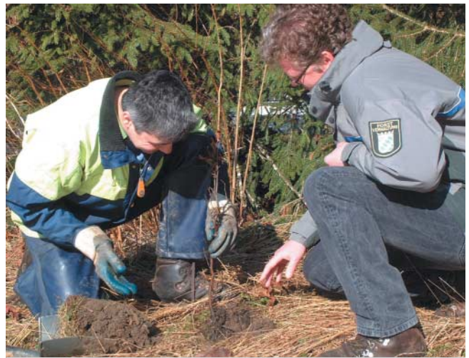
Revierleiter kontrolliert mit dem Pflanze die Pflanzenqualität

Die Kontrolle auf festen Sitz der Pflanze oder das Anwuchsprozent allein reichen für die Beurteilung der Pflanzqualität nicht aus.