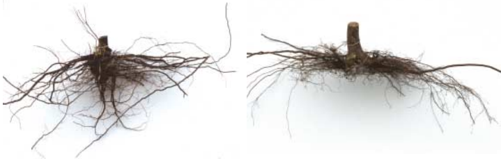
links: 10-jähriger Bergahorn: Fachgerecht gepflanzt rechts: 10-jähriger Bergahorn: Unsachgemäß gepflanzt

Das beste Pflanzverfahren ist nur so gut wie seine Anwendung. Bereits kleine Pflanzfehler können die Wurzelentwicklung stark beeinträchtigen.