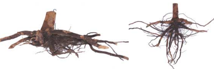
Zehnjähriger Bergahorn: links: Winkelpflanzung mit sehr flachem, einseitigen Wurzelwerk. rechts: Naturverjüngung mit sehr guten Tiefenwurzeln.

Natürlich verjüngte/gesäte Bäume haben im Vergleich zu gepflanzten Bäumen weniger und schwächere Wurzeldeformationen. Aus diesem Grund lassen sich Deformationen besonders effektiv und kostengünstig durch Naturverjüngung oder Saat vermeiden.