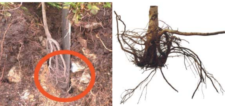
links: Stauchung beim Pflanzen: Die Wurzeln werden umgebogen. rechts: Stauchung nach 10 Jahren: Die Wurzeln wachsen nicht mehr in die Tiefe.