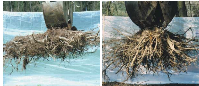
links: 35-jähriger Bergahorn aus Winkelpflanzung: Sehr flachstreichendes Wurzelwerk. rechts: 37-jähriger Bergahorn aus Lochhügelpflanzung: Kräftige Herzwurzeln, die weit in die Tiefe reichen.