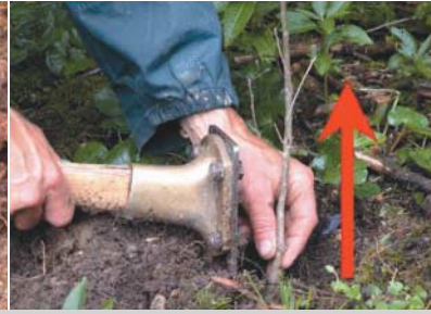
links: Pflanzloch: Wurzellänge und Raum zum Hochziehen. rechts: Pflanze vor Schließstich anziehen.